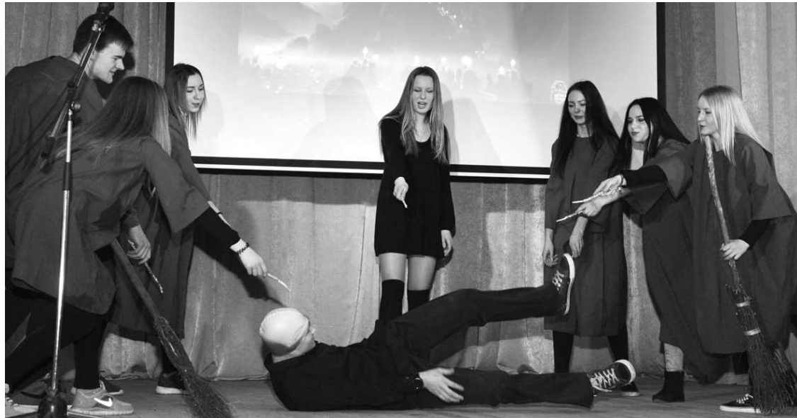
Hogvarsto burtų mokyklos auditorija salę pavertė raganomis ir burtininkais persirengę vienuoliktokai.