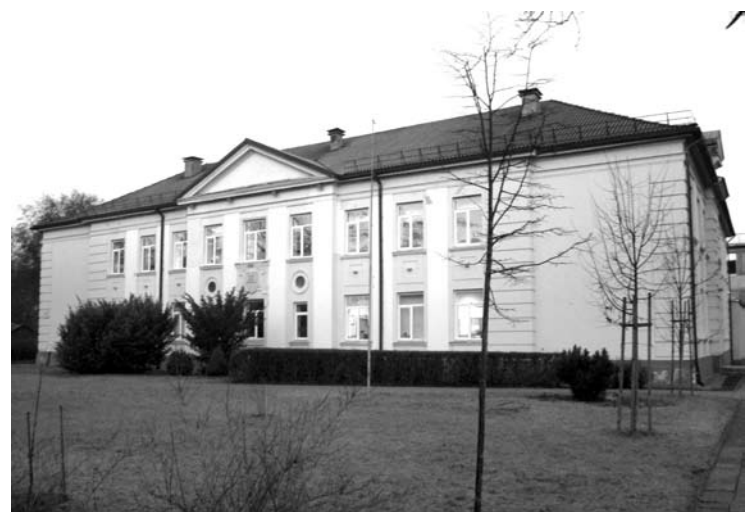
Anykščių Antano Vienuolio progimnazijos mokytojai dėl dviejų streiko dienų vidutiniškai neteks 40 eurų atlygio. Švietimo ir mokslo ministerijos duomenimis, vidutinis mokytojo atlyginimas Lietuvoje yra 800 eurų.

Nors Anykščių mokytojai streikavo tik dvi dienas, neterminuotas streikas šalyje tęsiasi ir toliau.